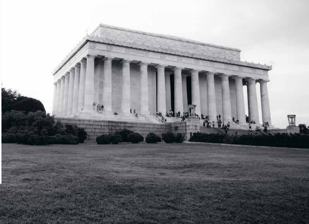
Lincoln Memorial, Washington

• Positiv målgrupp ◻ Neutral målgrupp ◼ Negativ målgrupp