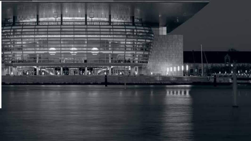
Operaen på Holmen, Köpenhamn

• Positiv målgrupp ◯ Neutral målgrupp ◼ Negativ målgrupp