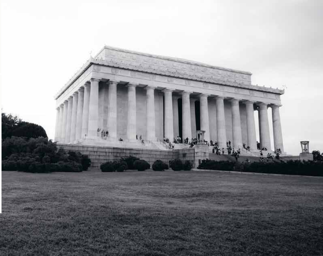
Lincoln Memorial, Washington

• Positiv målgrupp ○ Neutral målgrupp ● Negativ målgrupp