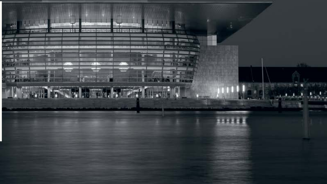
Operaen på Holmen, Köpenhamn

• Positiv målgrupp ○ Neutral målgrupp • Negativ målgrupp