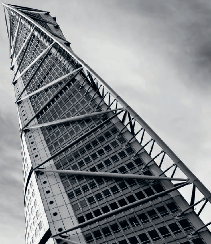
Turning Torso, Malmö

• Positiv målgrupp ○ Neutral målgrupp ● Negativ målgrupp