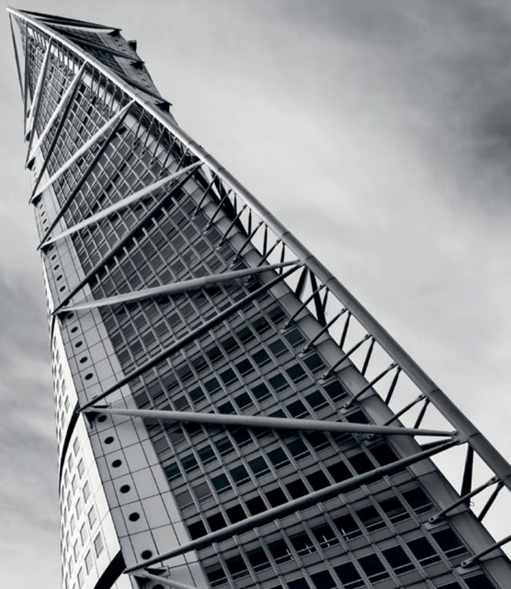
Turning Torso, Malmö

• Positiv målgrupp ○ Neutral målgrupp ● Negativ målgrupp