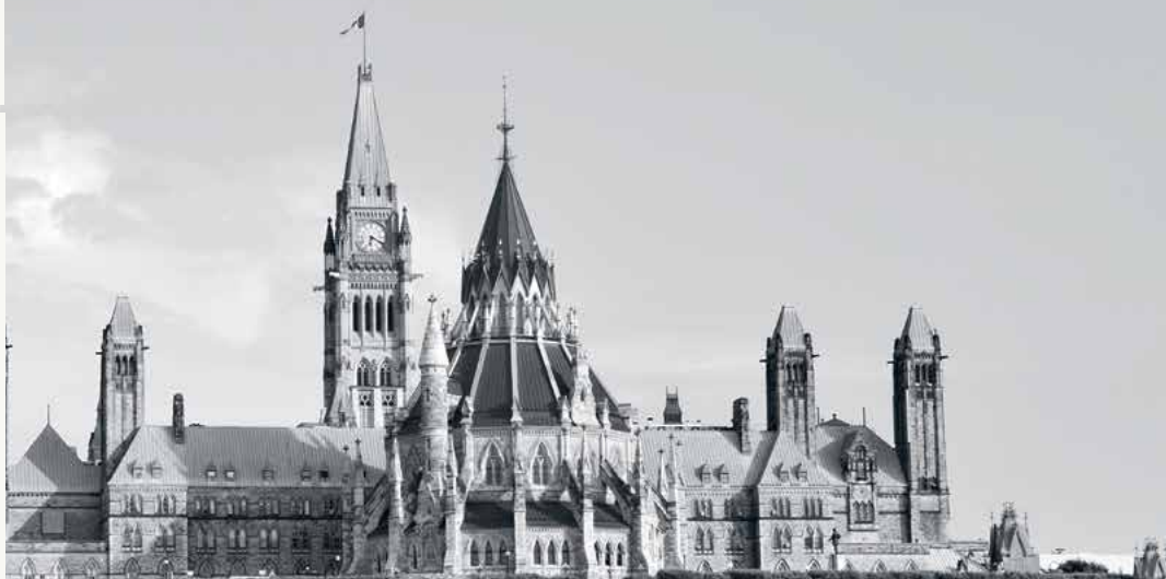
Parliament Hill, Ottawa

• Positiv målgrupp ◦ Neutral målgrupp ◦ Negativ målgrupp