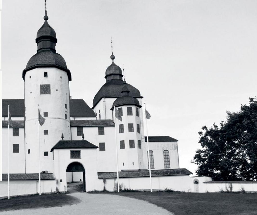
Läckö Slott, Lidköping

• Positiv målgrupp ○ Neutral målgrupp ● Negativ målgrupp