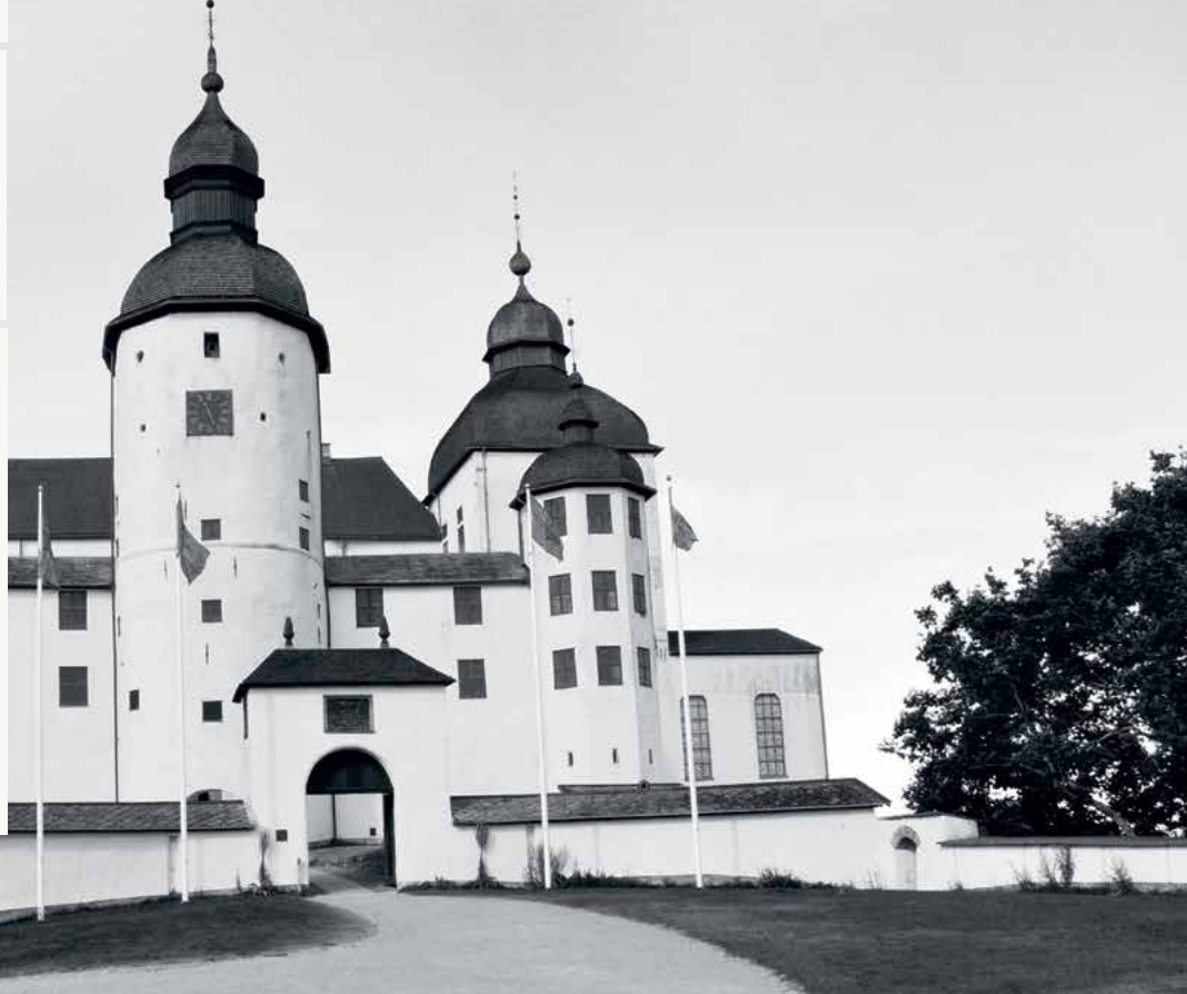
Läckö Slott, Lidköping

• Positiv målgrupp ○ Neutral målgrupp ● Negativ målgrupp