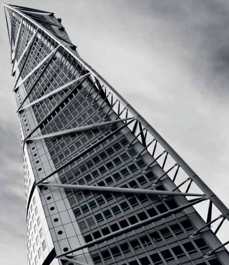
Turning Torso, Malmö

• Positiv målgrupp ○ Neutral målgrupp ● Negativ målgrupp