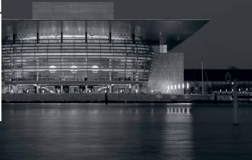
Operaen på Holmen, Köpenhamn

• Positiv målgrupp ○ Neutral målgrupp ● Negativ målgrupp