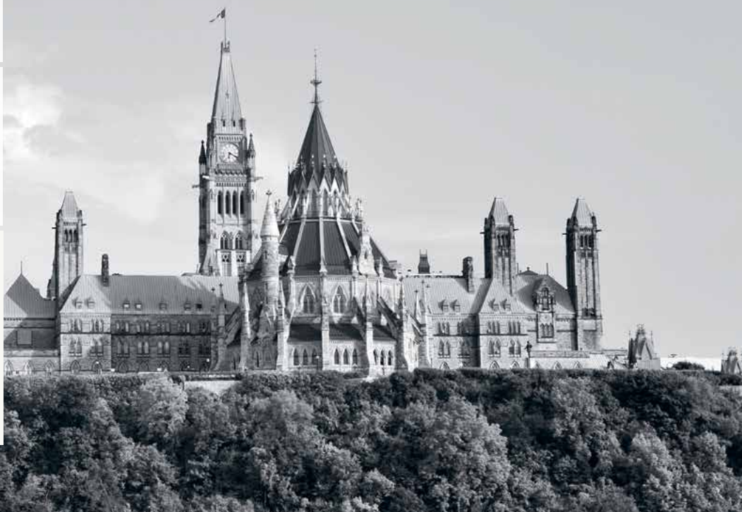
Parliament Hill, Ottawa

Denna placering lämpar sig för distributionsstrategi B-D. För mer information se sidan 6.