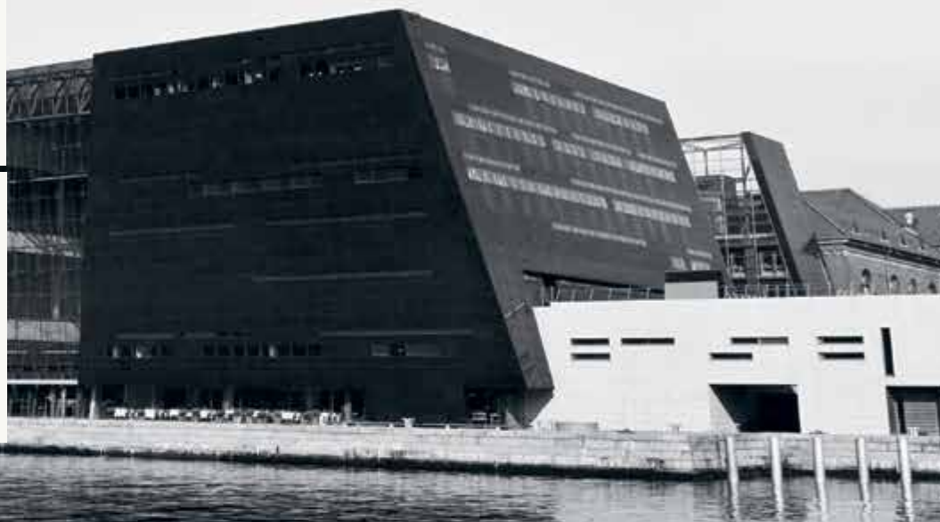
Det Kongelige Bibliotek, Köpenhamn