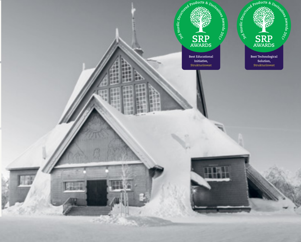
Kiruna kyrka, Kiruna.