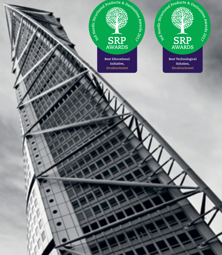
Turning Torso, Malmö