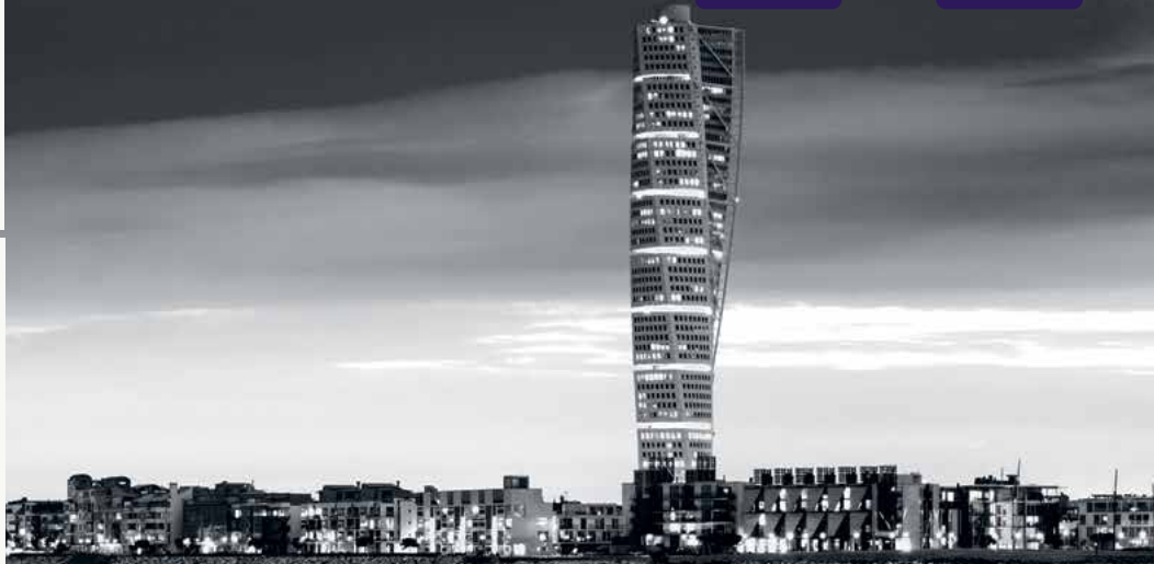
Turning Torso, Malmö

Best Technological Solution, Strukturinvest