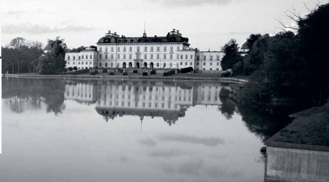
Drottningholms Slott, Stockholm