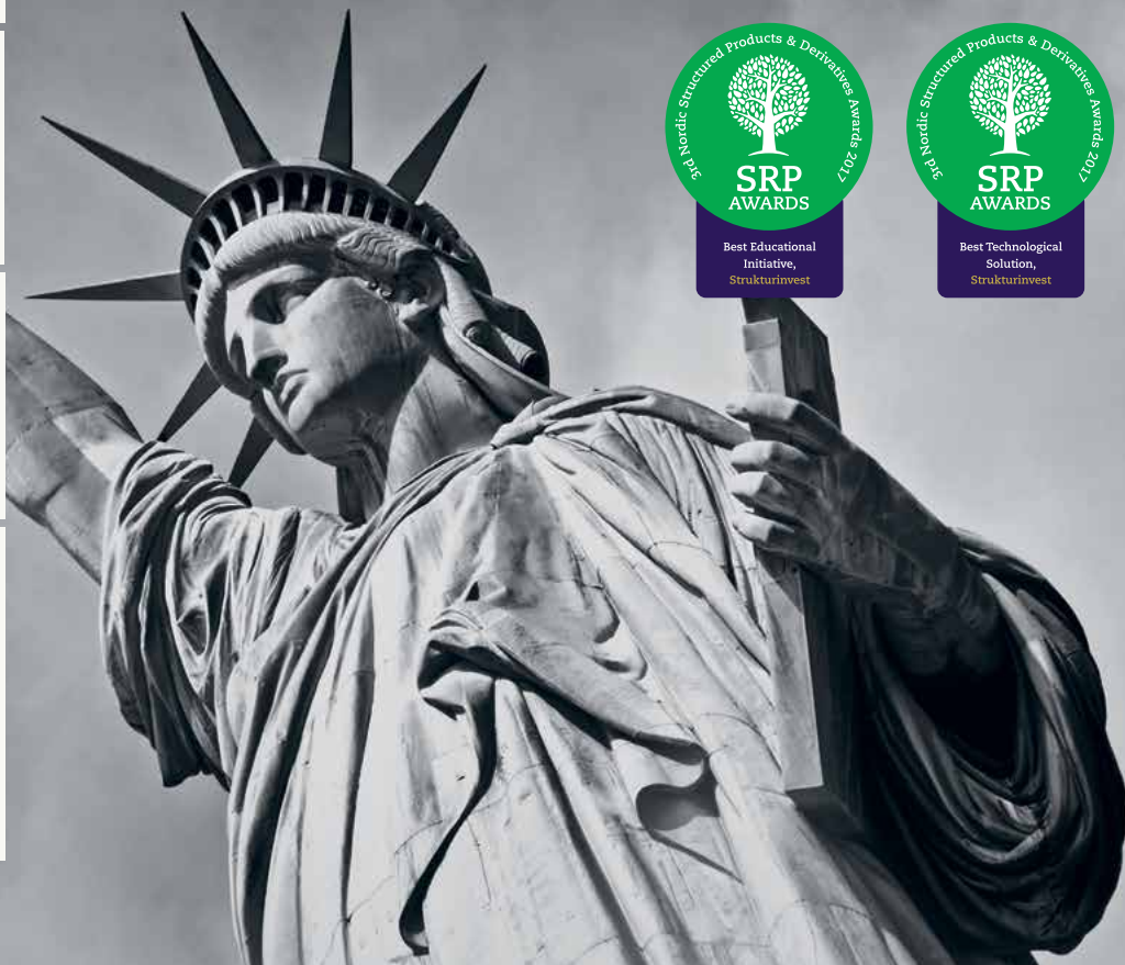
Frihetsgudinnan, New York