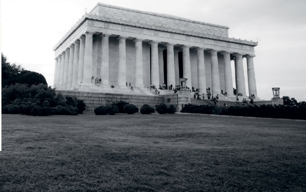
Lincoln Memorial, Washington

* Positiv målgrupp ◻ Neutral målgrupp • Negativ målgrupp