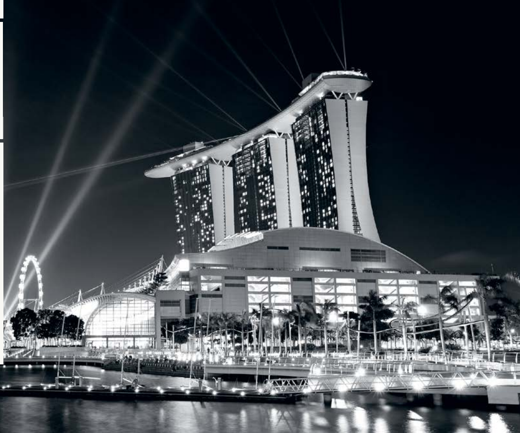
Marina Bay Sands, Singapore

• Positiv målgrupp ◦ Neutral målgrupp • Negativ målgrupp