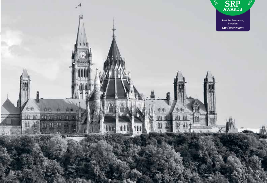
Parliament Hill, Ottawa